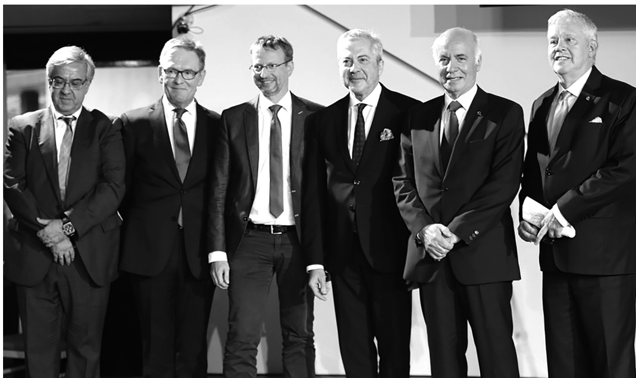
Лидеры Европейской организации по качеству

Принимала конгресс Финская ассоциация по качеству, которая отмечала свое 50-летие. Конгресс проходил под лозунгом «Качество благоприятствует развитию и конкурентоспособности» и собрал представителей 26 стран из разных частей света.