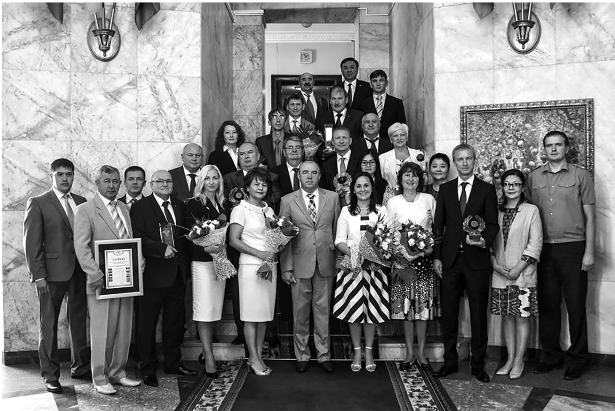
Победители конкурса на соискание премий СНГ за достижения в области качества продукции и услуг

12 июля 2016 года в штаб-квартире СНГ в Минске проведена церемония награждения победителей конкурса на соискание премии Содружества Независимых Государств 2015 года за достижения в области качества продукции и услуг.