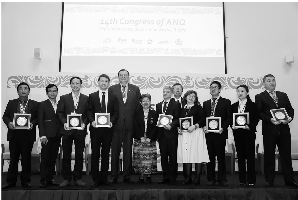
Лауреаты международных премий в области качества

Чтобы претендовать на премию, необходимо разработать и реализовать серьезный проект по улучшению деятельности своей организации в области качества. Конкурсный отбор проходил в Китае, Корее, России, Индии, Вьетнаме, Сингапуре, Японии и других странах ANQ. В этом году высокой награды удостоены сразу две отечественные организации, а общее число победителей в России возросло до восьми. Примечательно, что среди них есть и Государственное автономное учреждение здравоохранения «Детская республиканская клиническая больница Министерства здравоохранения Республики Татарстан» . За консультациями по вопросу участия в конкурсе Азиатской сети качества можно обращаться в технический секретариат Совета по присуждению премий Правительства Республики Татарстан за качество, г. Казань, ул. Большая Красная, 8 или по тел. 8(843) 292-04-95.