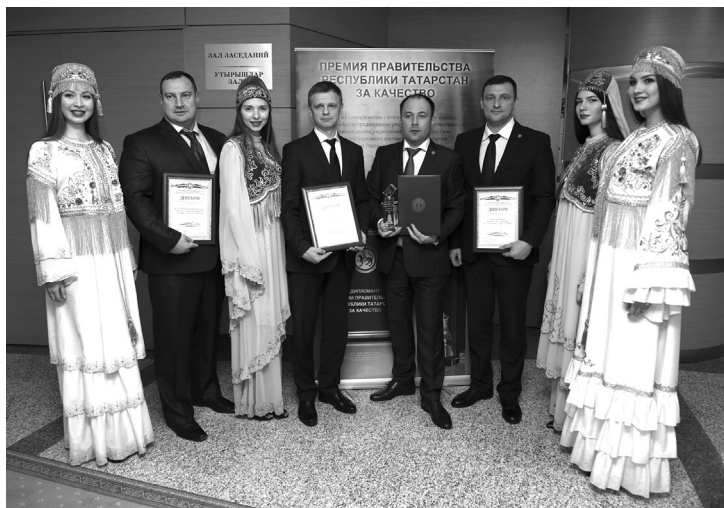
Лауреаты конкурса на соискание премий Правительства Республики Татарстан за качество 2015 года