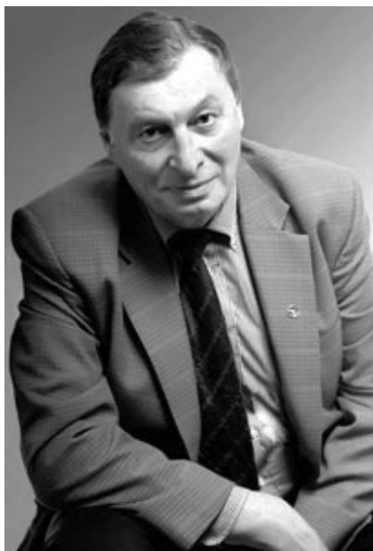
Гусаков Юрий Абрамович, первый вице-президент Всероссийской организации качества, председатель Азиатской организации качества (ANQ), экс-президент (2005—2001 гг.) Европейской организации качества, доктор экономических наук, профессор, член Академии проблем качества России